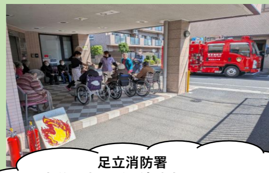
足立消防署 大谷田出張所の消防士さんにご来訪頂きました。